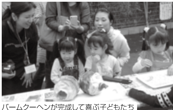
バームクーヘンが完成して喜ぶ子どもたち

親子で一緒に、竹の芯にホットケーキミックスでつくった生地をつけて、竹を回しながら焼くのを繰り返すと、バームクーヘンは少しずつ大きくなっていきました。出来上がったバームクーヘンを切ると、中はちゃんと年輪状になり、子どもたちは、できたてのバームクーヘンをほおぼりながら「おいしい」と喜んでいました。