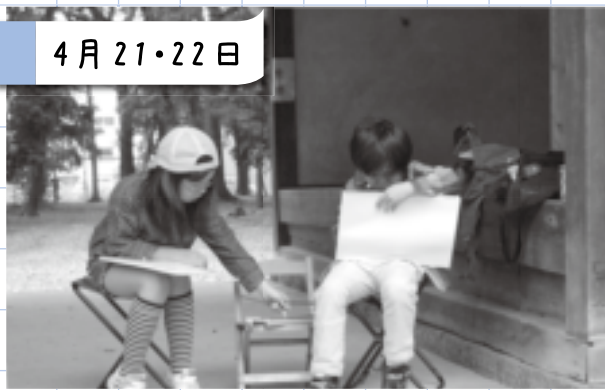
絵を描こう のってみよう のってこバス(町内一円)