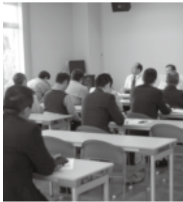
▲会議に使用される交流室

ひ、活用ください。 「ものづくりのまち久御山」の情報発信と異業種の皆さんの交流の場として、会議やセミナーなどに交流室をぜひ、活用ください。