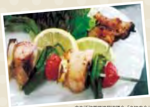
食生活改善推進員協議会「久味の会」