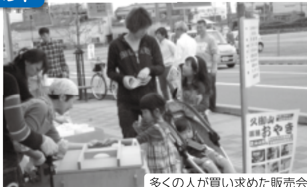
多くの人買い求めた販売会

20日に、町内企業の横のつながりを広げようと名刺交換会で幕を開けた記念イベントは、21日・22日の2日間に2,200人が来場。まちの野菜や特産品等の販売会をはじめ、町内で活動されるものづくりグループのオープン例会など多彩な催しで盛り上がりました。