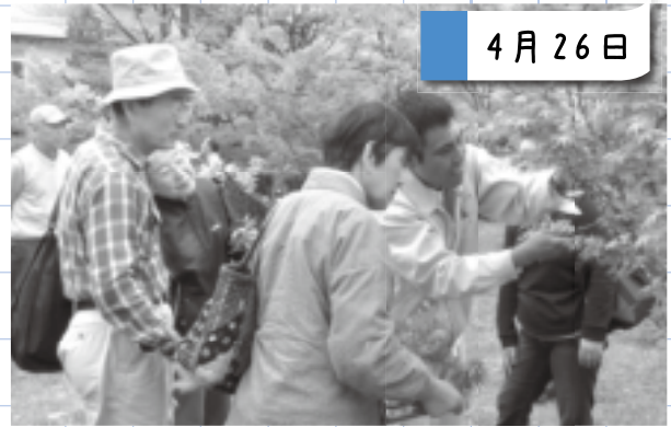
せん定教室(中央公園)