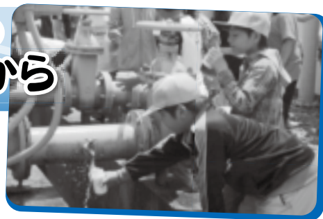
▲浄水場を見学する小学生

町では、安心・安全な水を供給するため、日ごろから施設の点検・整備や水道管の洗管作業をおこなっています。皆さんも、水道週間を機会に、水の大切さを考えてみましょう。