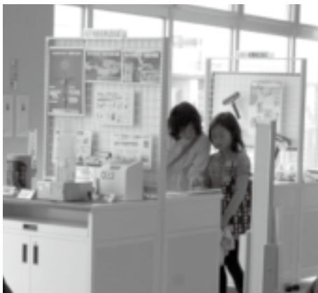
▲展示ロビーを見る親子

「ものづくりのまち久御山」の情報は、高度な技術を持つ中小企業が多い本町の企業が、どのような製品を製造しているのかを紹介するコーナーで、現在は、11社の自社自慢の製品を展示しています。 展示品には、ものづくりのまちを象徴する高度な技術に改めて驚く、いろいろな製品などが並んでいます。 まちの駅クロスピアくみやまにお越しのときには、2階展示ロビーで、「ものづくりのまち久御山」の各企業のすばらしい技術に触れてください。まちの再発見ができますよ！ 申し込み・お問い合わせ／まちの駅クロスピアくみやま ☎075(63)22300