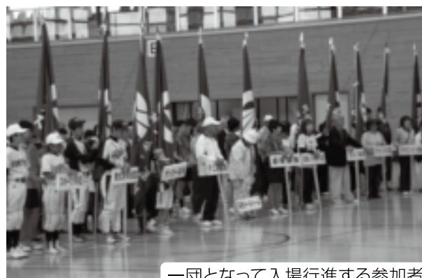
一団となって入場行進する参加者