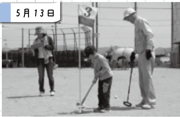
田井まなび塾(NTT淀総合運動場)